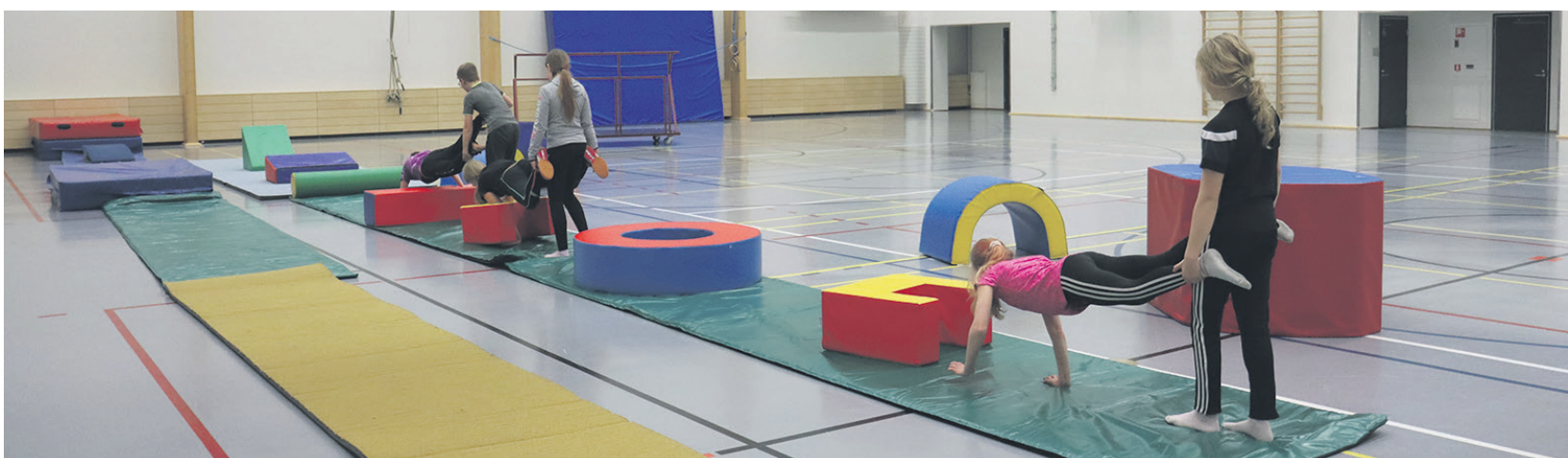
Lihakset töihin esterataharjoituksessa.