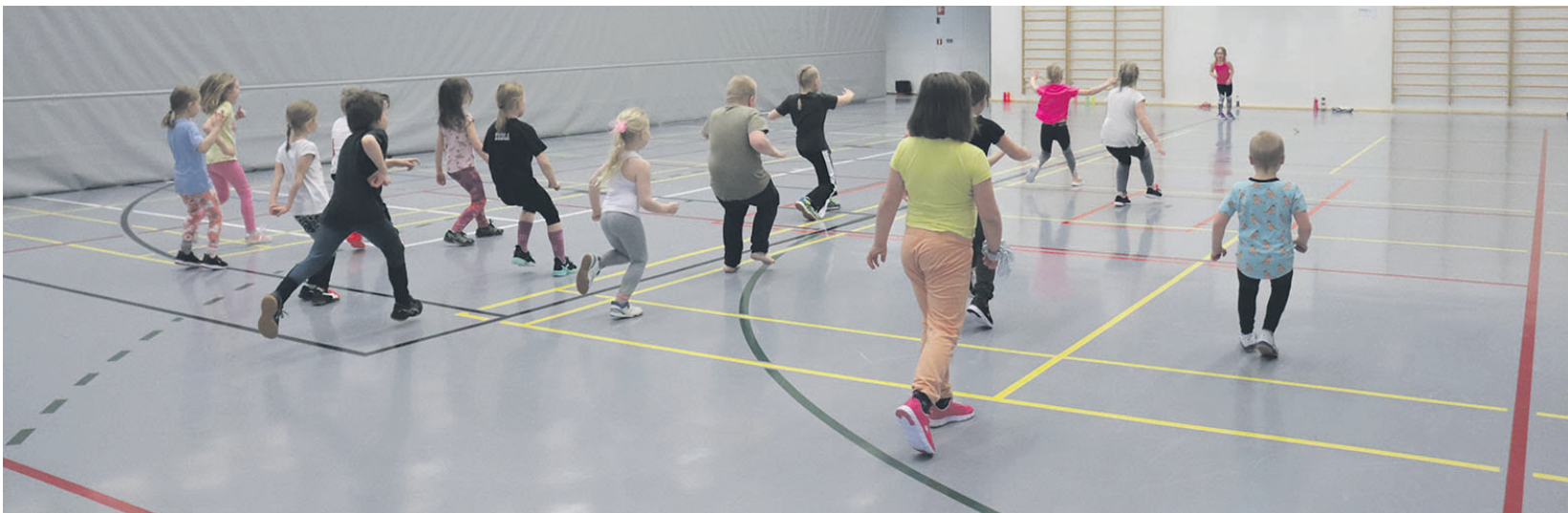
Urheilukoulun pienten ryhmän 5-8-vuotiaat innokkaat liikkujat.

Tunnin aikana harjoitellaan liikunnallisia perustaitoja, joiden hallitseminen on perusta myöhemmin opittaville lajitaidoille. Jokainen lapsi huomioidaan yksilönä niin, että kaikilla on mahdollisuus oppia ja onnistua. Innostava ja kannustava ohjaus saa jokaisen tekemään parhaansa. Yhdessä tekemisen riemu on vahvasti läsnä eivätkä muutkaan tunteet ole kiellettyjä. Liikunta ja urheiluhan on mitä suurimmassa määrin tunnetta, yleensä iloa, mutta pettymykset ja kyneleetkin kuuluvat urheiluun niin kuin elämään muutenkin. Anteeksipyyntöä ei unohdeta, jos epähuomiossa pahoitetaan toisen mieli. Ryhmässä opitaan kannustamaan kaveria ja käyttäytymään muutenkin hyvässä urheiluhengesessä. Täten luodaan perustaa lapsen kasvuun toisten huomioivaksi, liikkuvaksi aikuisiksi.