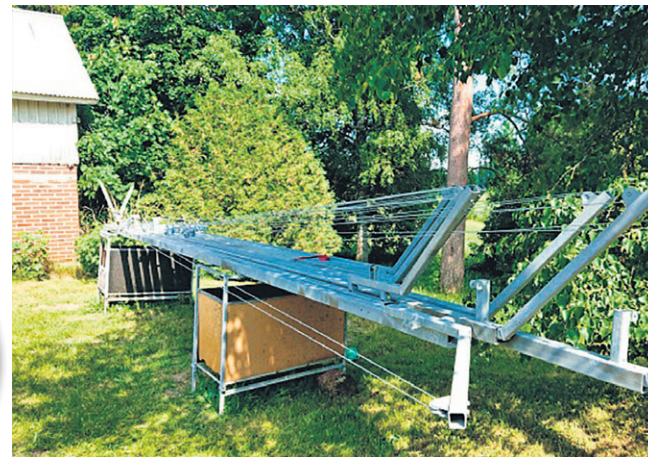
Uudet vinsit, 27.6.2020.