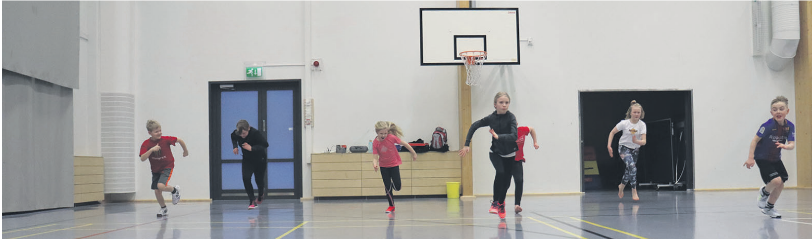
Isompien eli yli 8-vuotiaiden urheilukoulussa tehtiin reaktioharjoituksia.