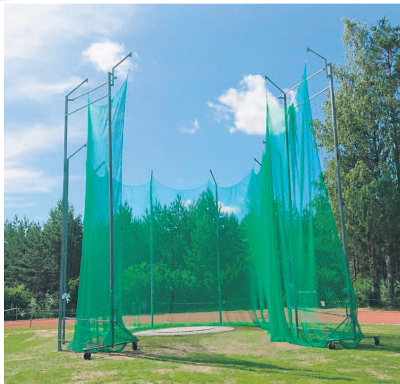
Uusi upea moukarihäkki valmiina käyttöön.