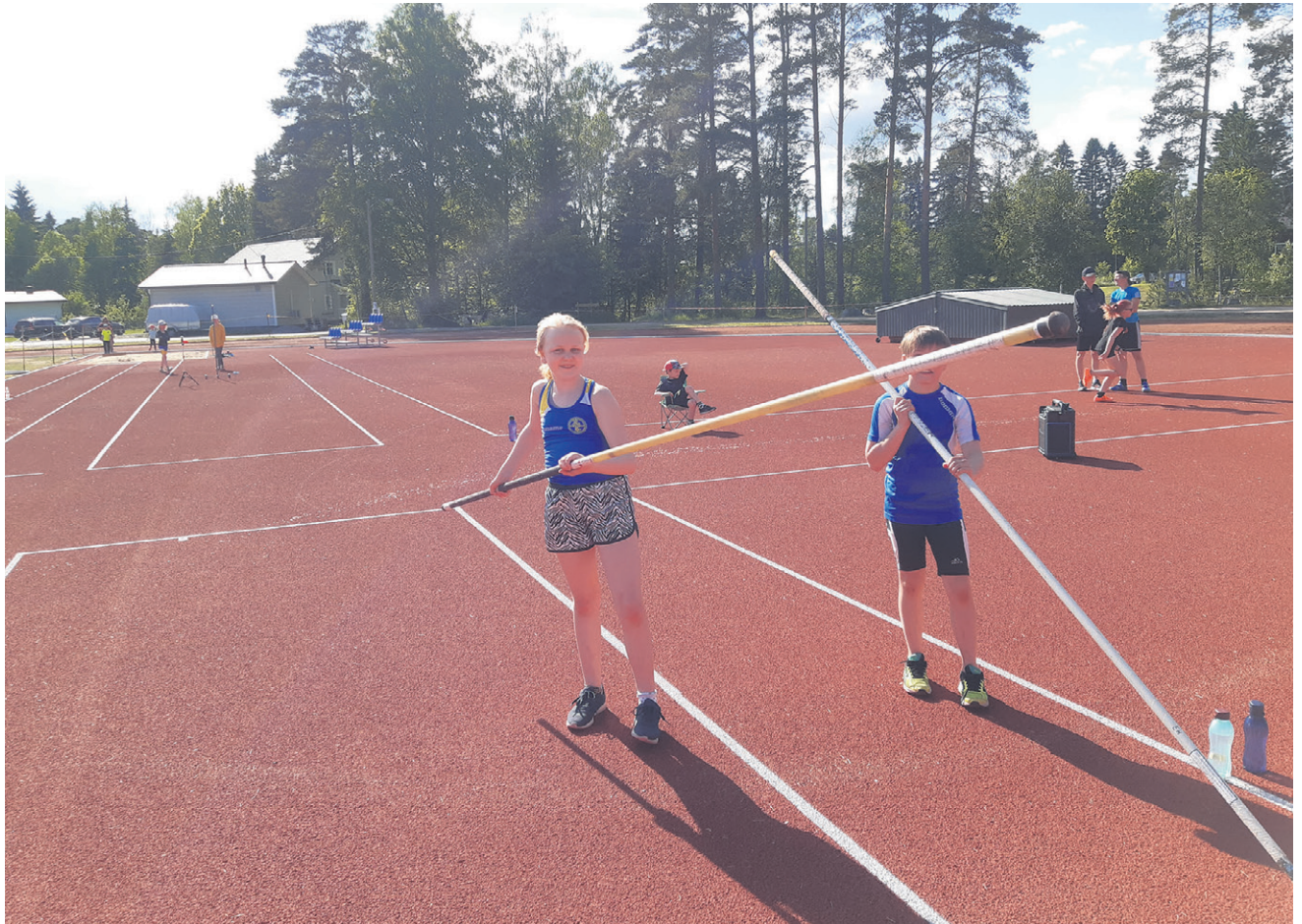
Hartolan kunnostetulla urheilukentällä onnistuu jälleen seiväshyppy vuosikymmenten tauon jälkeen.