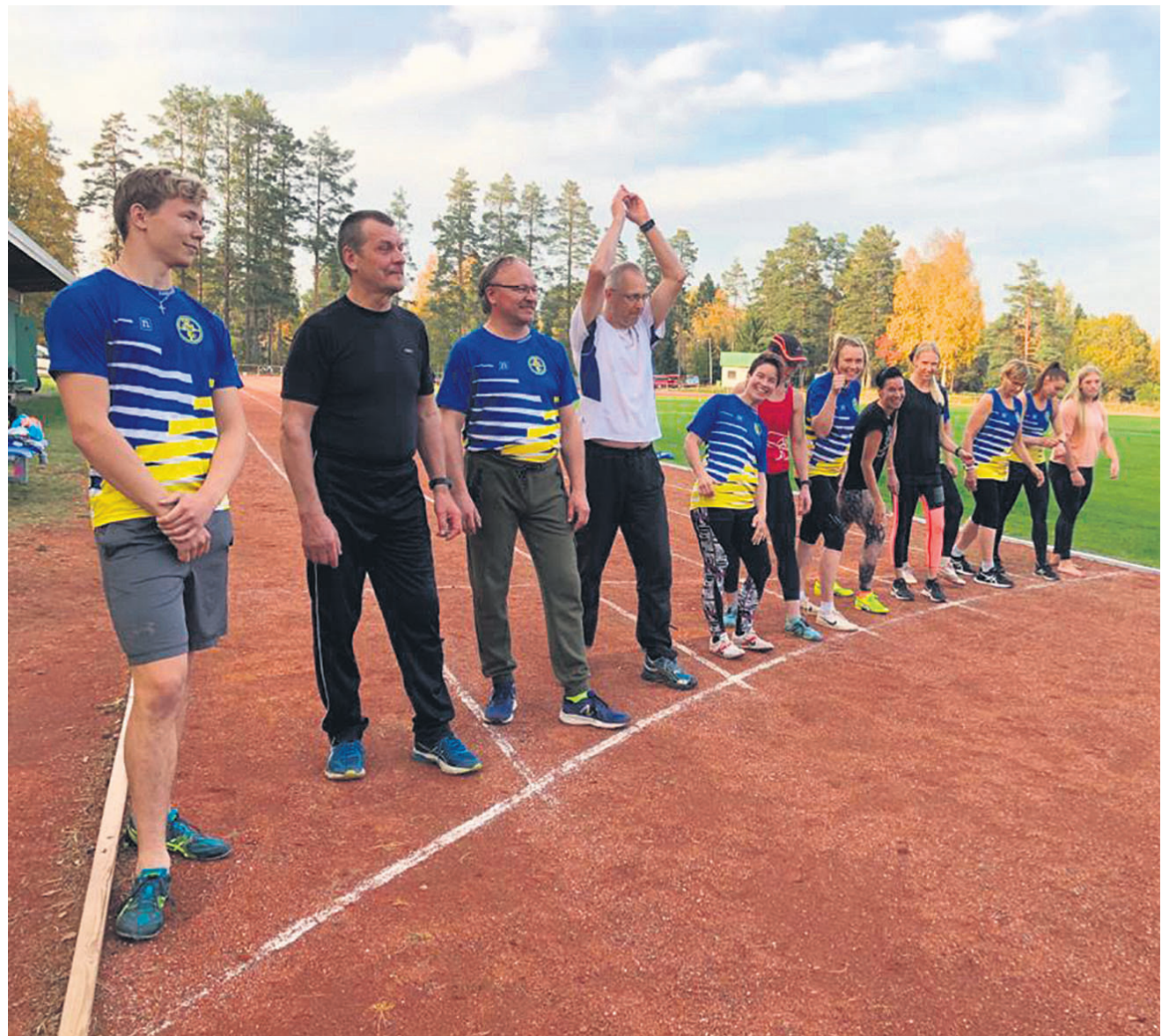
Voiman mestaruuskilpailujen 800 metrin lähtötunnelmia 26.9.2020.

ään ja ajatustensa selkiinnyttyä tuskan sumusta, jokainen oli takuulla ylpeä suoriutumisestaan 4-ottelun loppuun ja kenties jo mietti seuraavan kilpailukauden uusia tavoitteita ja niihin vaadittavaa systemaattista treeniä.