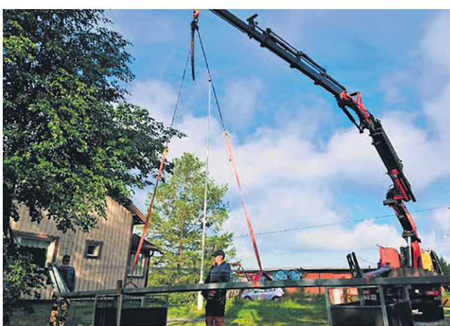
Tolpat lähdössä kentälle, 8.7.2020.