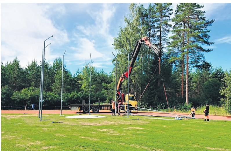
Tolppien pystytys urheilukentälle.