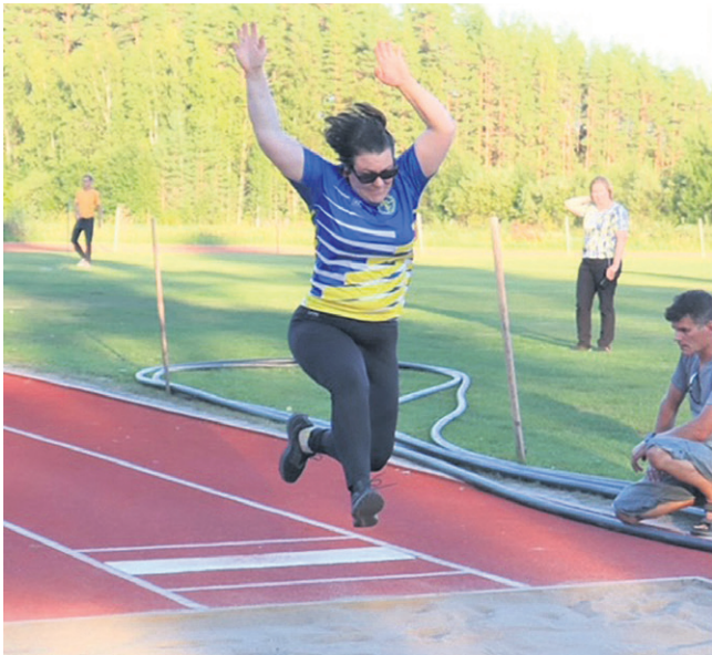
Satu pitää eniten heittolajeista, mutta pituushyppykin on- nistuu mallikkaasti.

MARI 43 , työskentelee parturi-kampaajana. Hänellä on kaksi kouluikäistä aktiivisesti urheilua harrastavaa lasta.