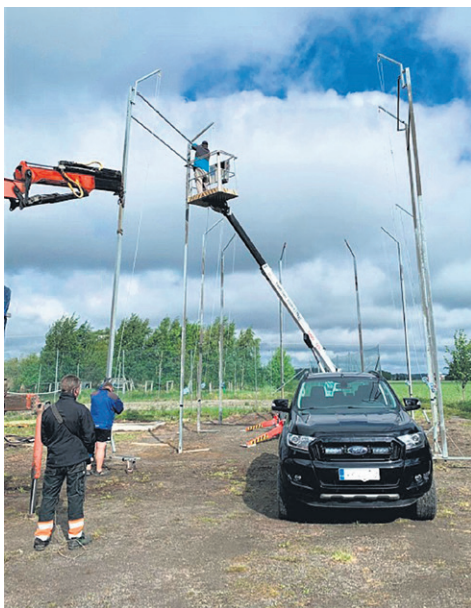
Häkin purku, Loimaa, 20.5.2019.